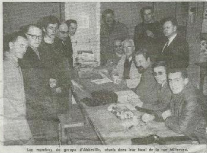
Les membres du groupe d'Abbeville, réunis dans leur local de la rue Millevoys.

Un groupe échange de vues a lieu également sur les problèmes techniques, ainsi que sur la préparation de l'installation des postes.