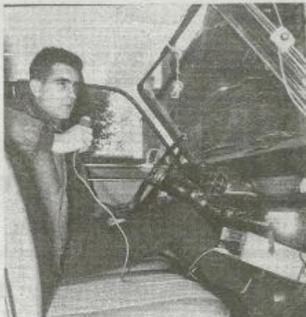
Un jeune radio-amateur (F5RQ) a installé un poste mobile dans sa voiture.

C'est un appel pour un médiateur sans qui est lancé sur les ondes, capta à des milliers de kilomètres par un amateur qui entre alors en contact avec d'autres correspondants et établit ainsi une chaîne de solidarité.